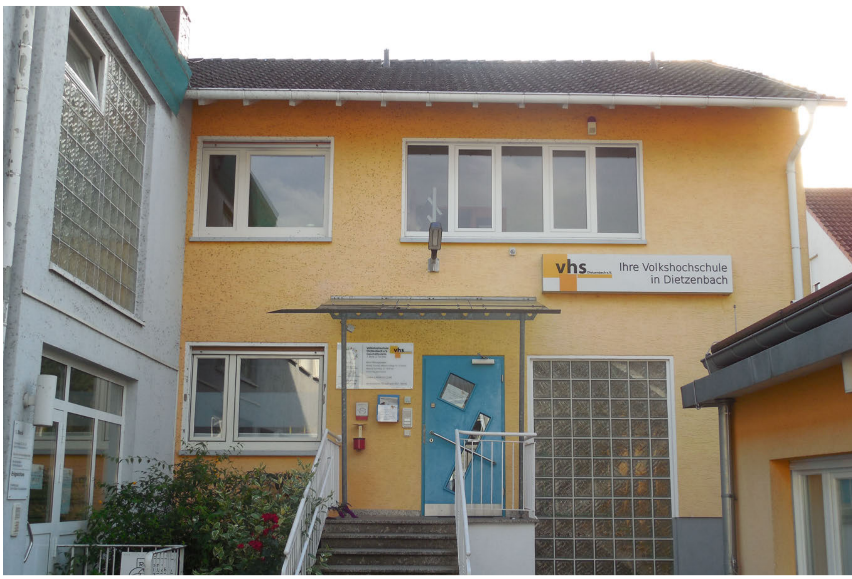
Unser Haus, die vhs Dietzenbach