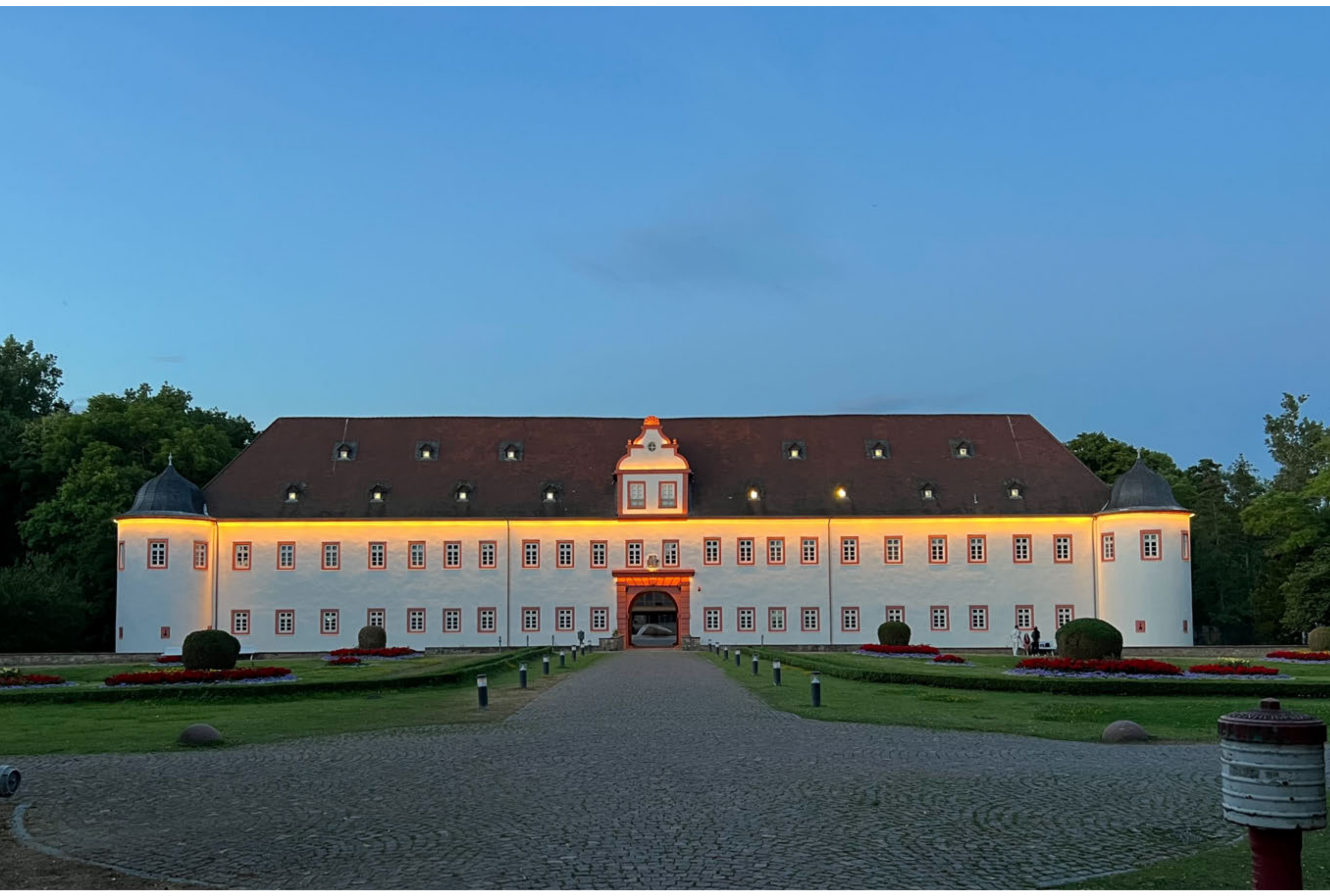
Rathaus Heusenstamm, Sitz der vhs