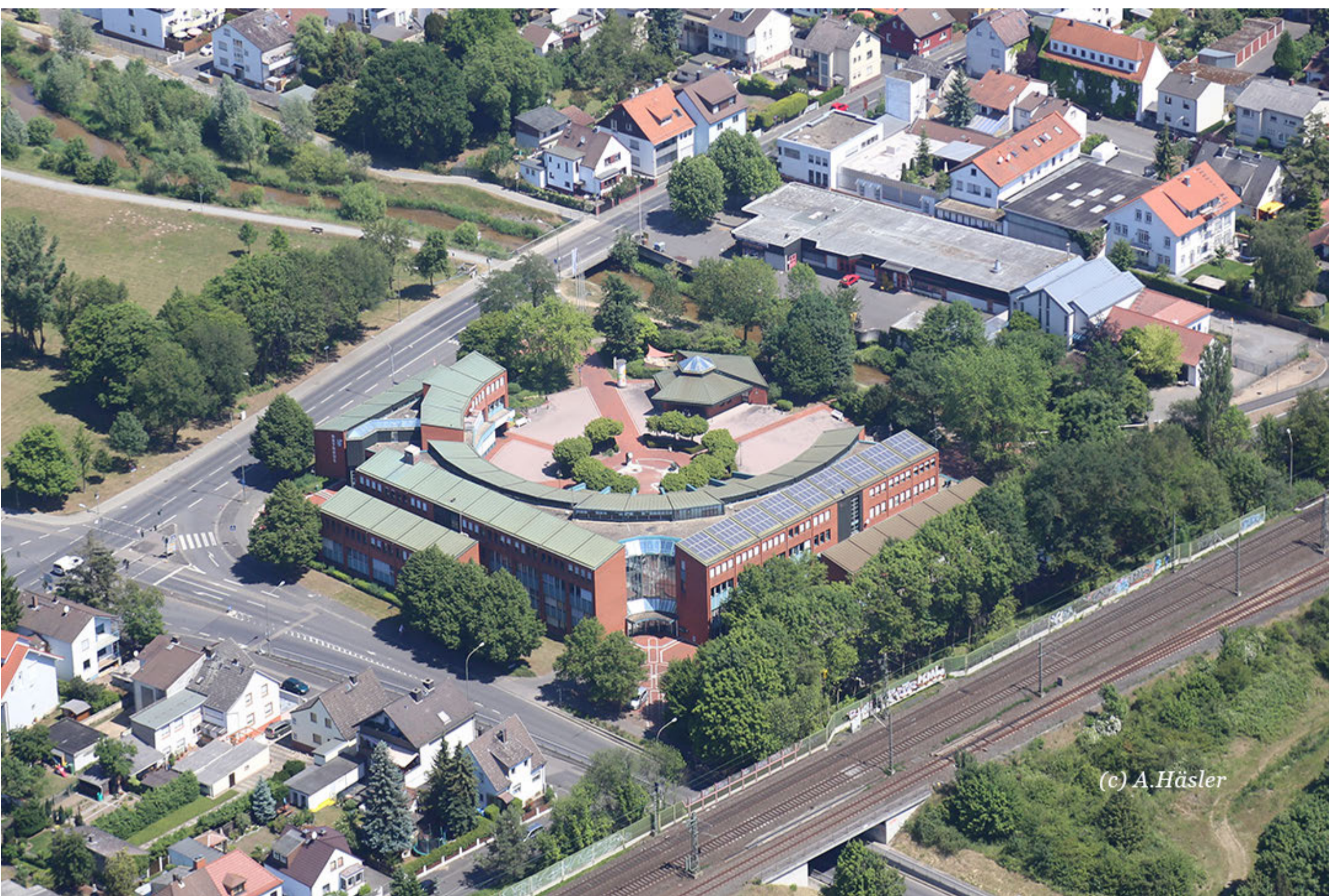
Der Sitz der vhs aus der Luft: Rathaus Mühlheim