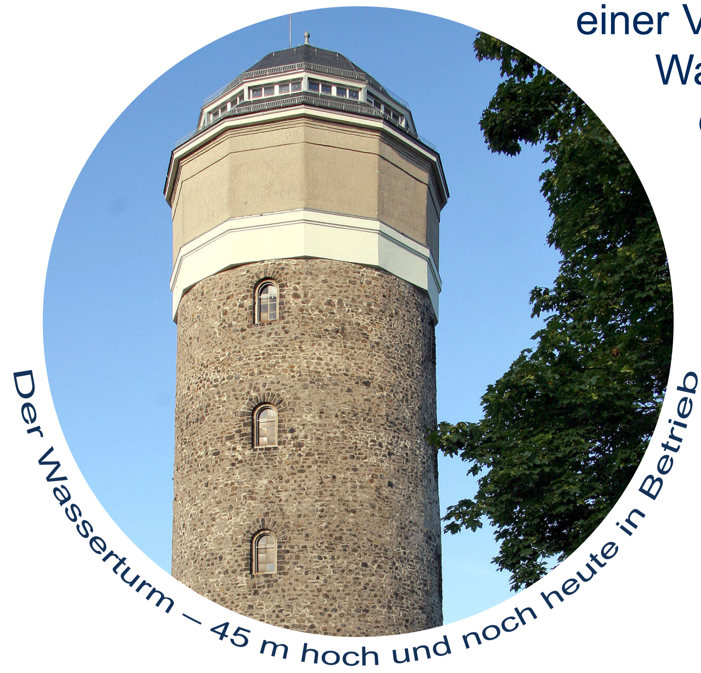
Der Wasserturm – 45 m hoch und noch heute in Betrieb