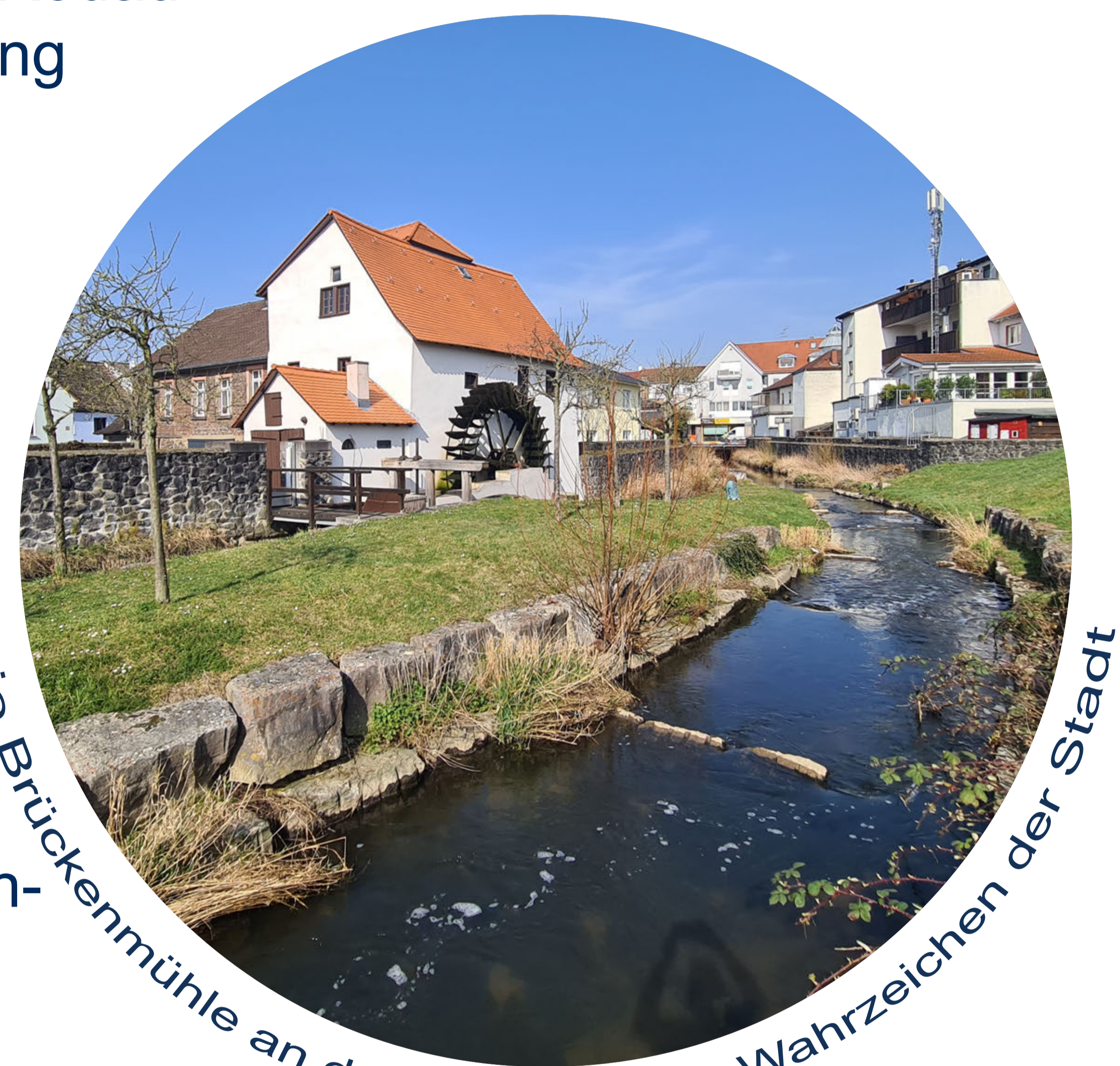
Die Brückenmühle an der Rodau – das Wahrzeichen der Stadt