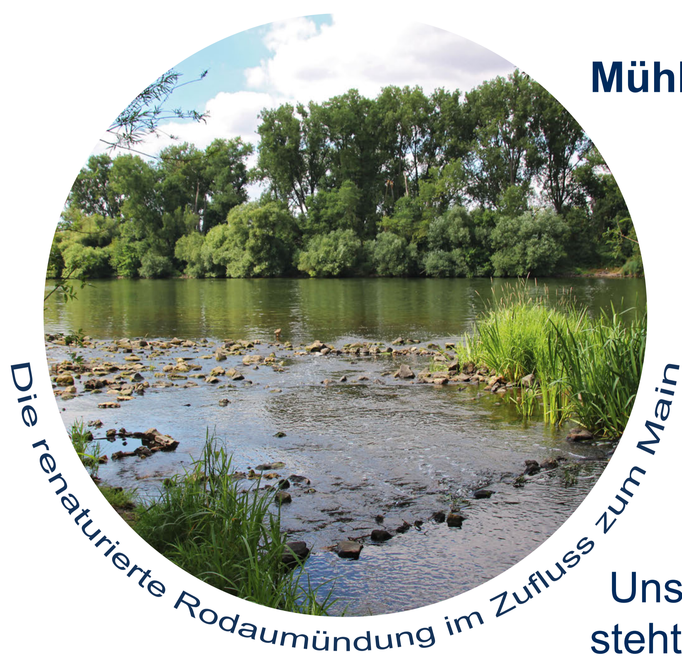
Die renaturalisierte Rodaumündung im Zufluss zum Main

Die Ressource „Wasser“ steht aktuell im Mittelpunkt einer Veranstaltungsreihe der vhs, bei der das Wasserwerk und der Wasserturm, der in den Jahren 1912 – 1914 erbaut wurde und noch heute in Betrieb ist, besichtigt werden können. Neben der Funktionsweise der Anlagen werden auch wichtige Tipps zum sinnvollen und sparsamen Umgang mit Trinkwasser gegeben.