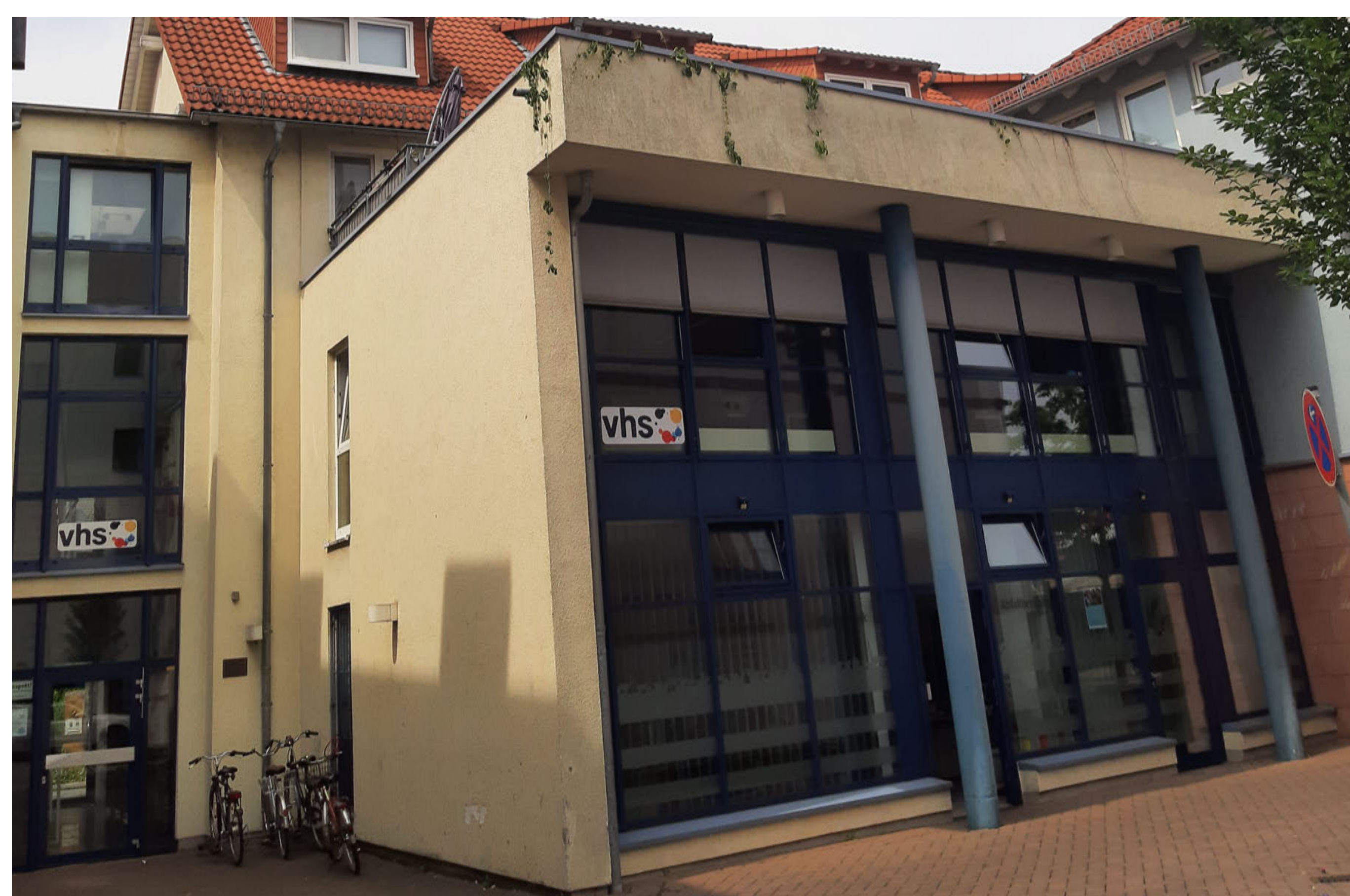
Die vhs im Zehnthof, Rödermark (Ober-Roden)