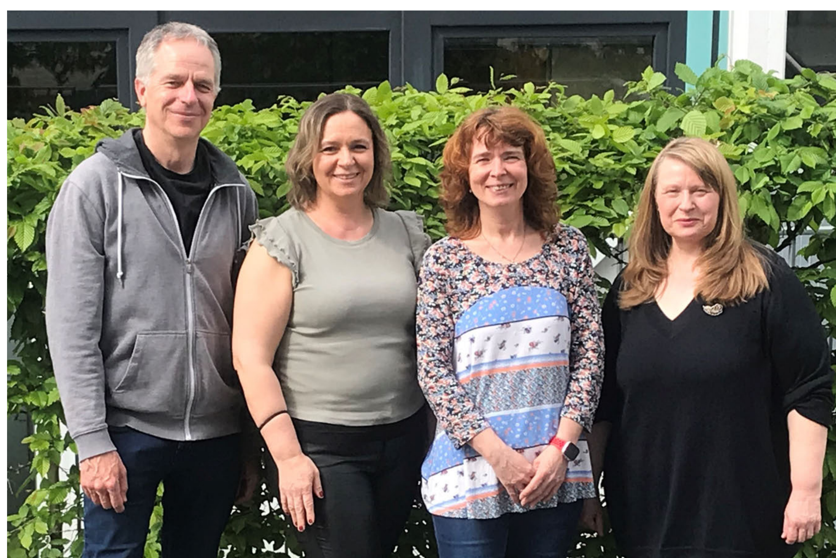
Unser Team für Rödermark